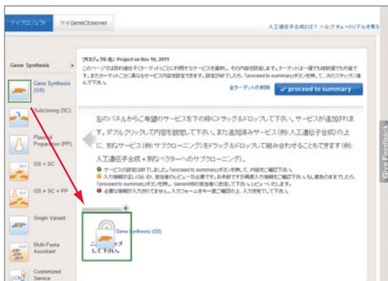
ドラッグ&ドロップでご希望の作業内容を構築できます。