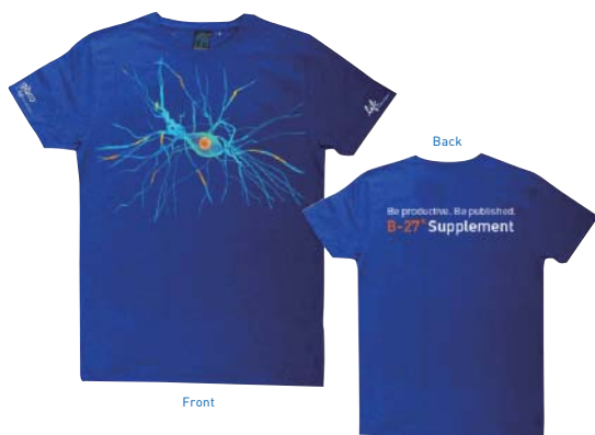
B-27™ オリジナルTシャツ